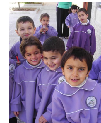
Schule in Bethlehem

Do.12.2. – So. 22.2.15 (11 Tage, Faschingsferien)