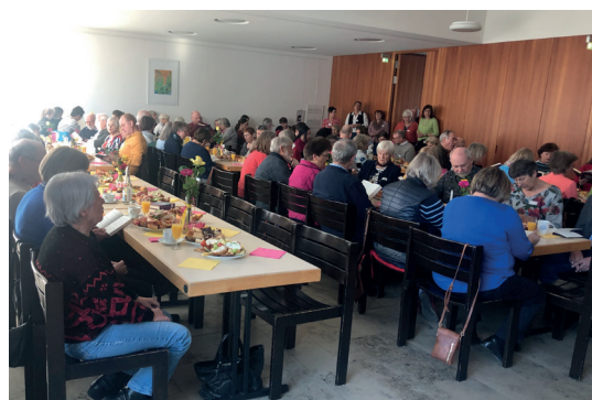
Mitarbeiterdankfest im Saal