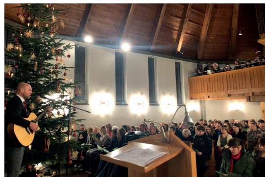
Hellig Abend in der Philippuskirche