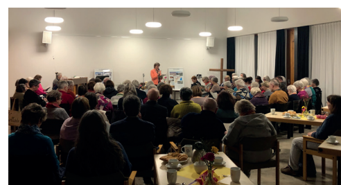
Ökumenischer Weltgebetstag im Saal